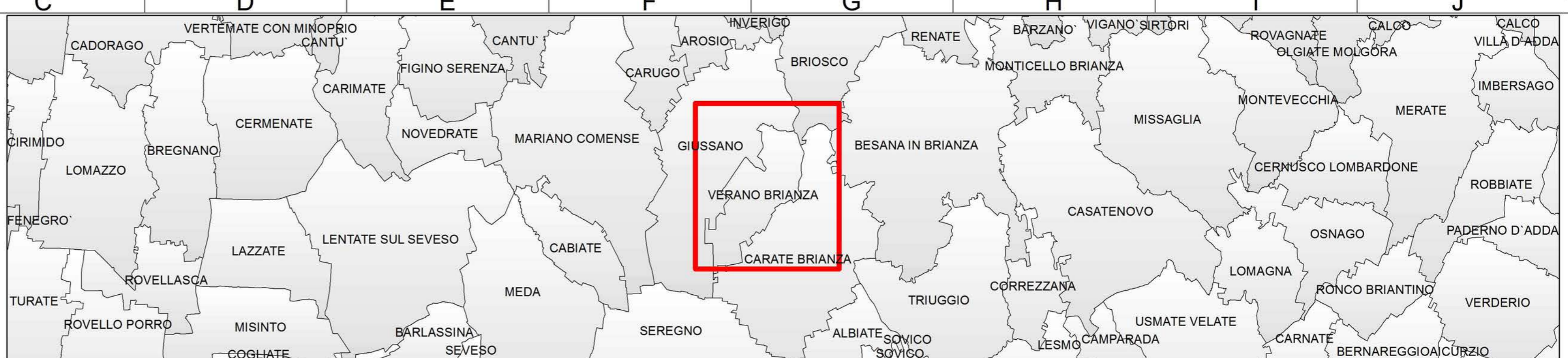
Inquadramento Livello Comunale